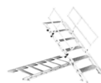
FT ER6-25A- ? V.0