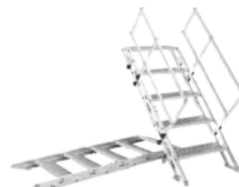
FT ER5-25A- ? V.0