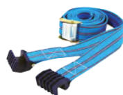
FT SS3-25A- ? V.0