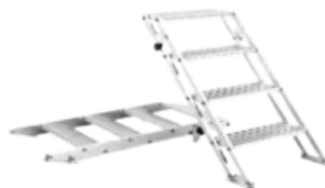
FT ER4-25A- ? V.0