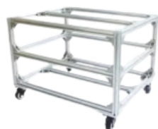
FT CRH-25A- ? V.0