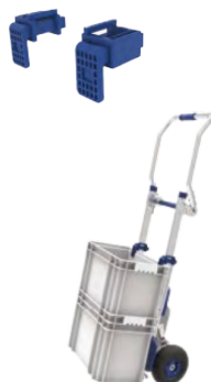
FT CM-25A- ? V.0