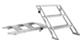
FT ER3-25A- ? V.0