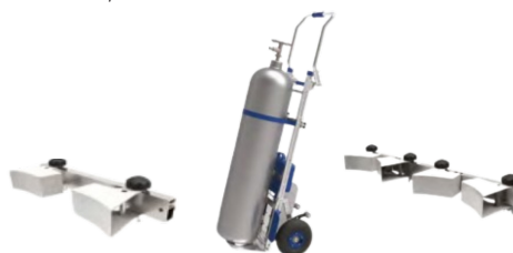
FT ESPB-25A- ? V.0