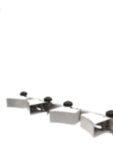
FT EDPB-25A- ? V.0